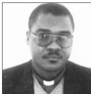
«...Bôña mam mômasona inyu lipem I Djôh» «...Fate tutto per la gloria di Dio»