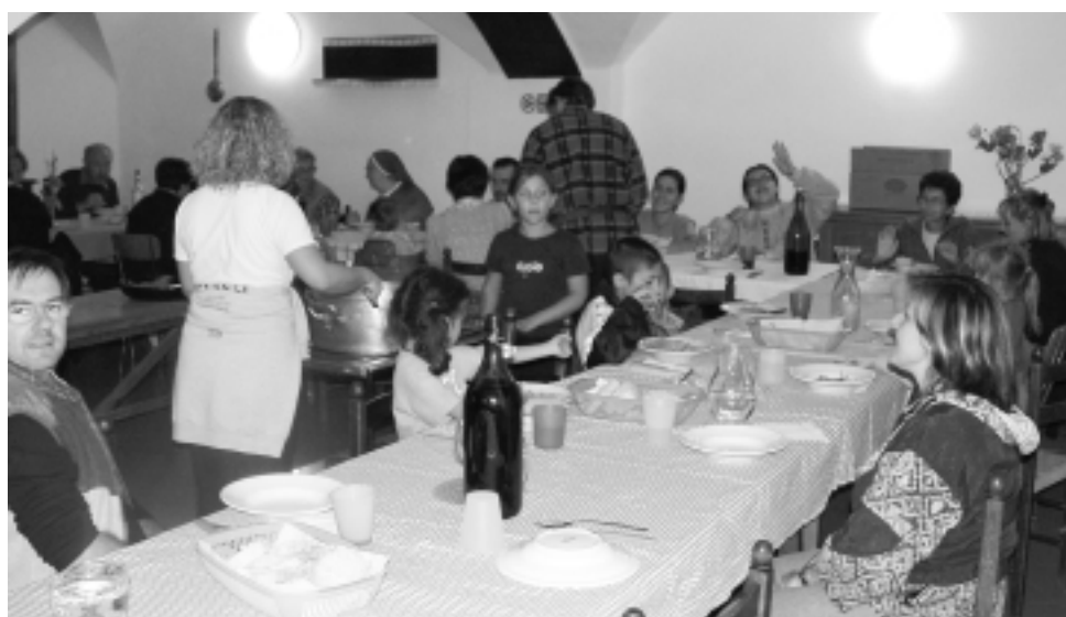
Momento conviviale durante il ritiro di programmazione a Soucheres Basses