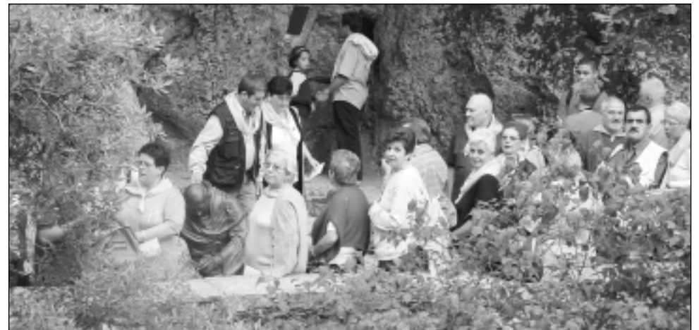
Sopra: visita all'Eremitaggio delle Carceri durante il pellegrinaggio ad Assisi.