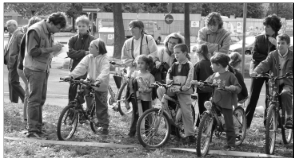
Sotto: festa patronale 2003: un momento della gimkana ciclistica per i bambini.