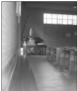
La nuova panca in legno

Oltre a questi "grandi lavori" ci sono ovviamente tutti quei piccoli interventi di manutenzione ordinaria che spesso ci sfuggono, ma che non di meno sono essenziali per il mantenimento delle strutture in efficienza: si va dai lavori di tinteggiatura dei locali alla pulizia degli ambienti, tutti opera silenziosa di un nutrito gruppo di volontari, ai quali vogliamo esprimere il ringraziamento di tutta la comunità.