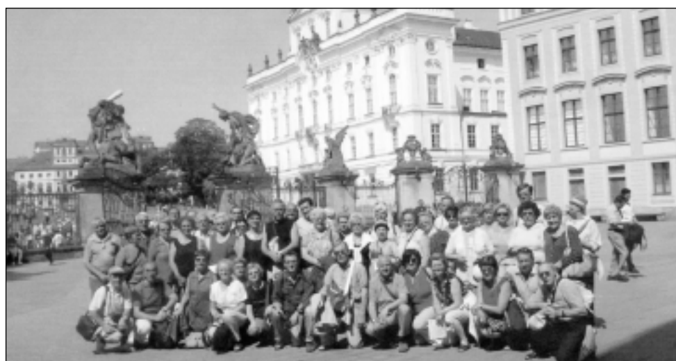
Il gruppo dei partecipanti al pellegrinaggio

Piazza degli eroi, il Castello reale, il Parlamento, l'Isola Margherita, tutti luoghi densi di storia e di fascino. Quello che più mi ha fatto sognare è stata la gita notturna sulle acque