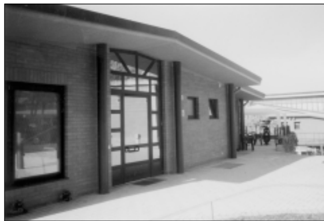
La Casa dell'Associazione "Case-famiglia P.G. Frassati"

Dal 1° agosto 2004 la "casa" dell'Associazione Case Famiglia Pier Giorgio Frassati, di strada Cigala 9 - Moncalieri, è abitata. Il 23 ottobre la "casa" è stata ufficialmente inaugurata. Questa casa è una Residenza Assistenziale Flessibile - RAF -, fondata dall'Associazione, è in grado di ospitare 10 persone con problemi di disabilità fisica. L'Associazione è l'Ente Gestore. Il comitato di gestione, nominato dal Consiglio Direttivo, comprende i disabili, che diventano pertanto protagonisti della propria vita. Il servizio alle persone e alla casa è affidato ad una cooperativa di assistenza per l'intero arco delle 24 ore e per tutti i