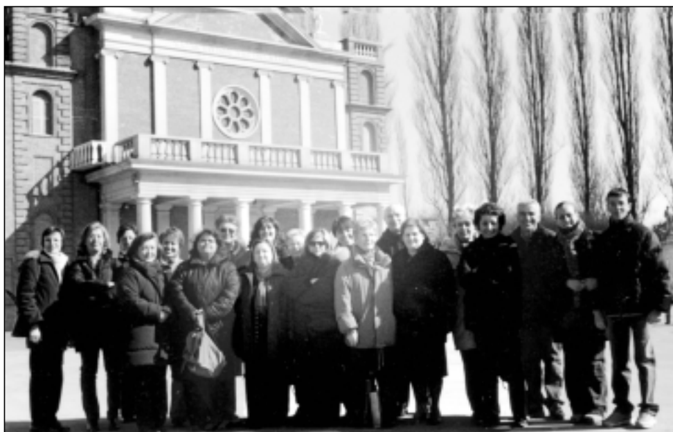
Catechiste e catechisti al completo