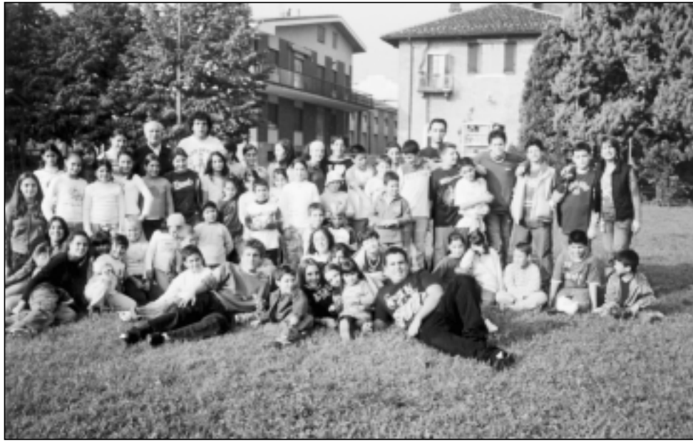
I ragazzi dell'oratorio

Eccoci qua! Vedete quanti siamo e quanta energia e allegria c'è nei nostri sorrisi? Come? Chi siamo? Siamo i ragazzi e gli animatori dell'oratorio di San Barnaba che dal pomeriggio di sabato 15 ottobre 2005 invadiamo pacificamente la Parrocchia e la trasformiamo nel nostro regno. Cosa si fa in questo regno? Prima legge fondamentale è: divertirsi. Vi possiamo garantire che in questo oratorio il gioco, l'allegria e la gioia dello stare insieme non mancano mai. Anzi, crescono di sabato in sabato. Seconda legge del nostro regno è: crescere insieme. Ebbene sì, ogni sabato cerchiamo di aiutarci a crescere insieme, condividiamo le nostre esperienze e affrontiamo problemi grandi e piccoli che la vita ci presenta. La terza legge è la più importante di tutte: impariamo a conoscere e amare sempre di più Ge-