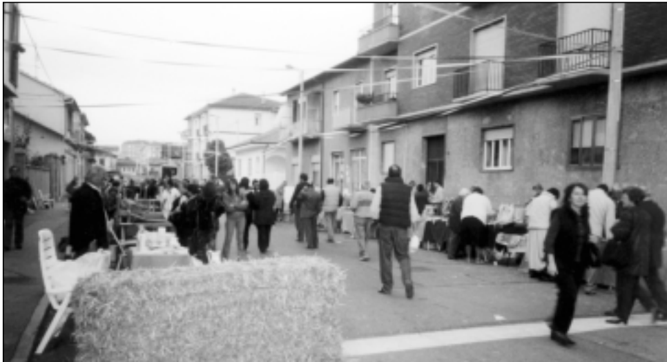
Strada Comunale di Mirafiori animata dal pubblico in visita alle bancarelle e agli artigiani che presentano gli "Antichi mestieri"

La storica Borgata Mirafiori è stata animata da una simpatica manifestazione, la "Rievocazione storica di una giornata di festa - Mirafiori 1901".