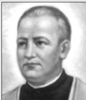
Beato Clemente Marchisio

Queste pagine del giornale "Mirafiori Sud" tragheranno alla festa del Natale e così ne approfitteremo per augurare a tutta la comunità parrocchiale e a tutte le persone che leggeranno un Buon Natale.