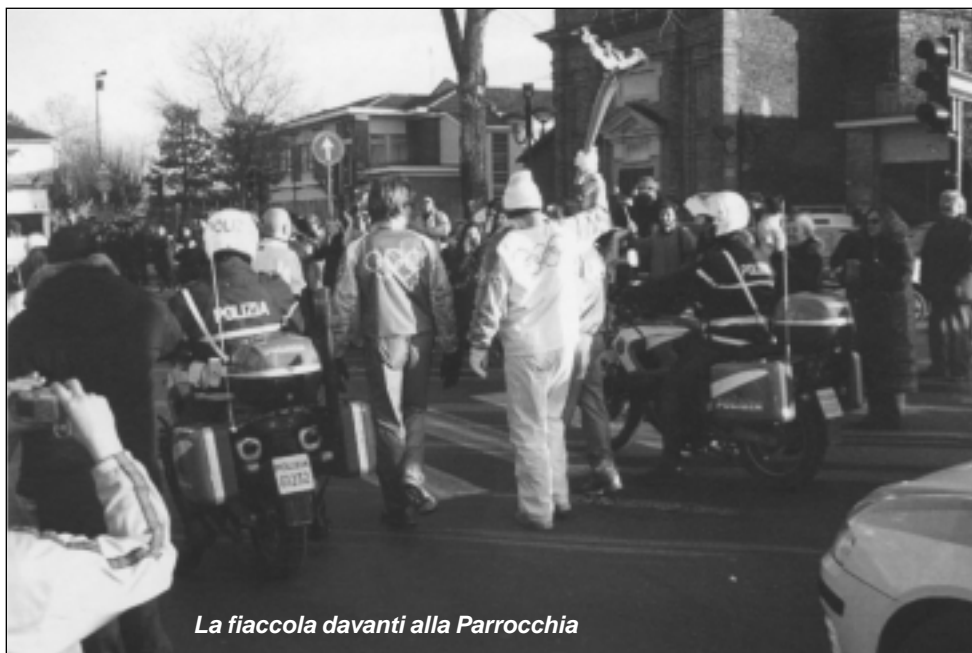
La fiaccola davanti alla Parrocchia

Giovedì 9 Febbraio la nostra Parrocchia ha assistito a un evento storico: il passaggio della Fiaccola Olimpica. Accolta da centinaia di persone festanti. È stato sicuramente un momento di gioia e festa, for-