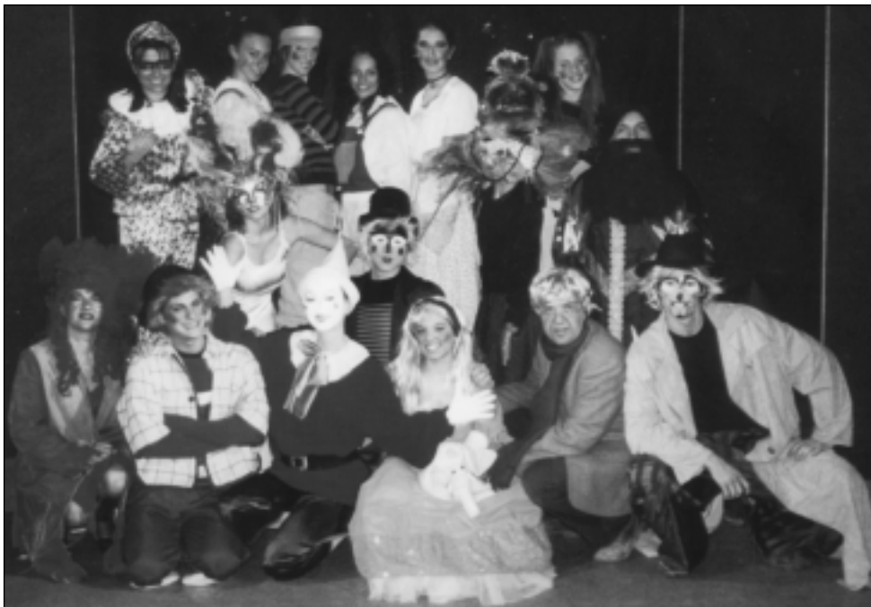
I protagonisti dello spettacolo

C'era una volta? Un re! No, un pezzo di legno!... un pezzo di legno che a noi Cantandò ha insegnato molto, un burattino davvero speciale che noi definiamo magico davvero!