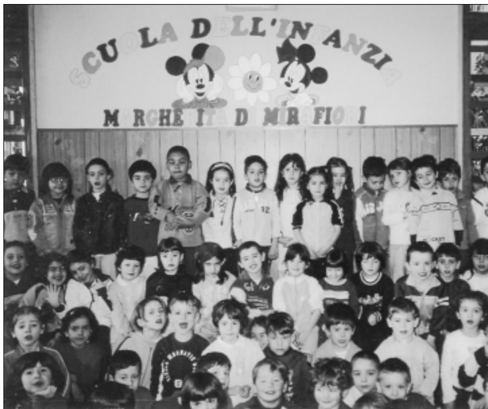
Bimbi della scuola materna