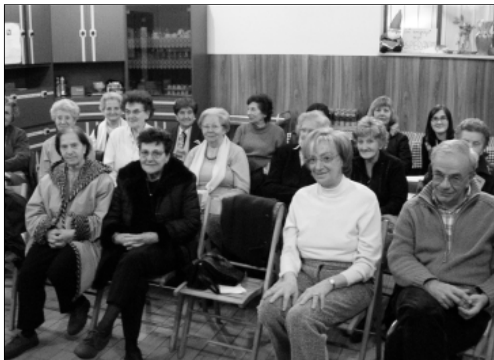
Alcuni partecipanti del Gruppo Anziani