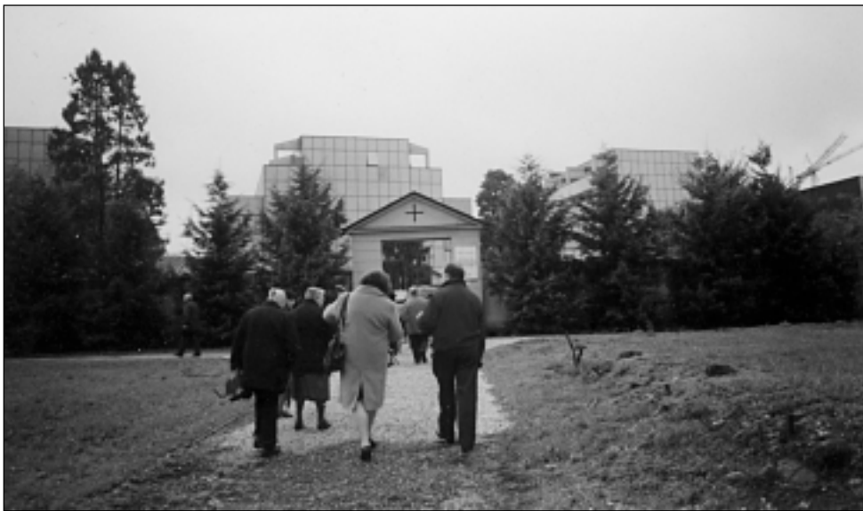
Il Cimitero di Mirafiori Sud

Per la festa di Ognissanti tutta la comunità parrocchiale è chiamata a raccogliersi in preghiera nel cimitero di corso Unione Sovietica. Anche quest'anno si rinnoverà la bella tradizione che ormai da