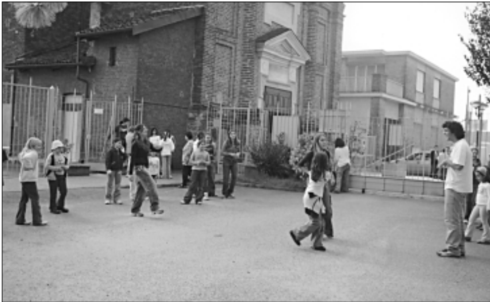
L'oratorio riprende l'attività

Sabato 21 ottobre ricomincia l'attività dell'oratorio della nostra Parrocchia. Anche quest'anno un gruppo di valorosi e sempre più validi animatori sono disposti ad aiutare i ragazzi a divertirsi in modo sano, allegro e ad aiutarli a crescere sia umanamente che nel loro rapporto con Gesù.