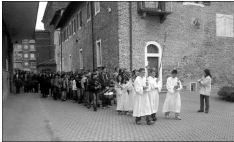
I ragazzi del catechismo guidano la processione delle Palme

Pensiero: perché la nostra fede è una risposta, spesso difficile, mai banale, a tutto ciò che è il mistero della vita e del mondo che