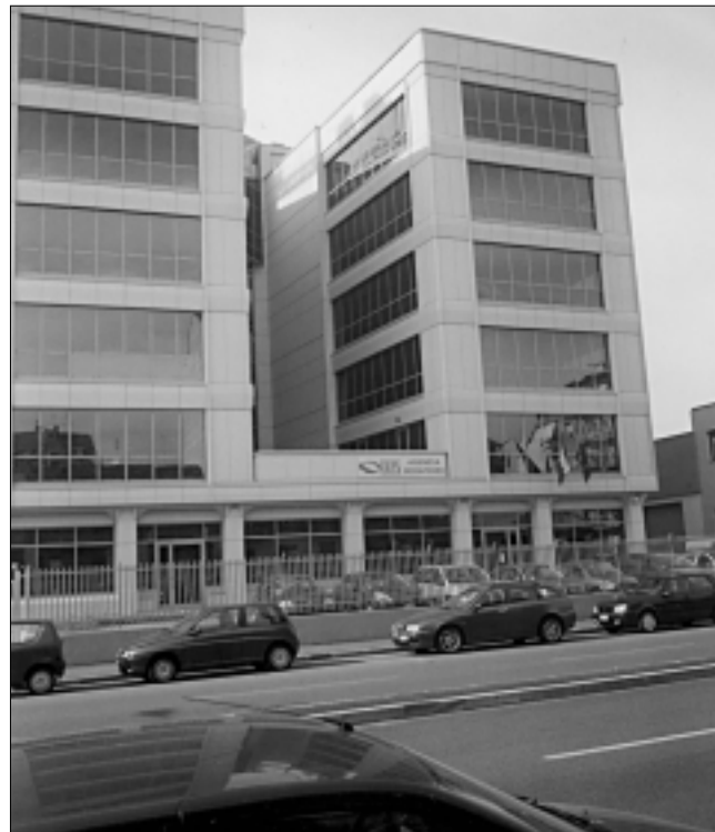
La nuova sede dell'INPS

La nuova sede dell'INPS, in vista di un successivo contatto fisico con i funzionari degli sportelli. Il canale telematico è il sito Internet www.inps.it , il canale telefonico è il numero verde 803.164.