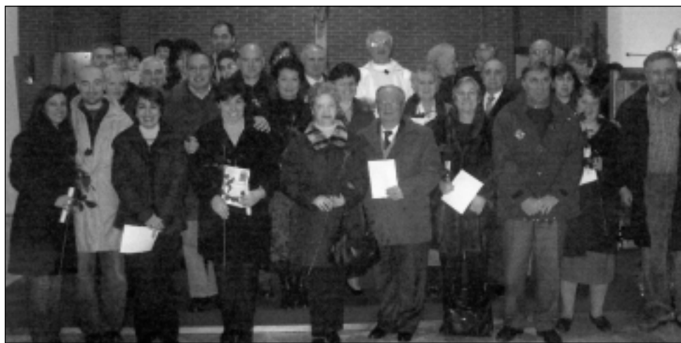
Le famiglie festeggiate