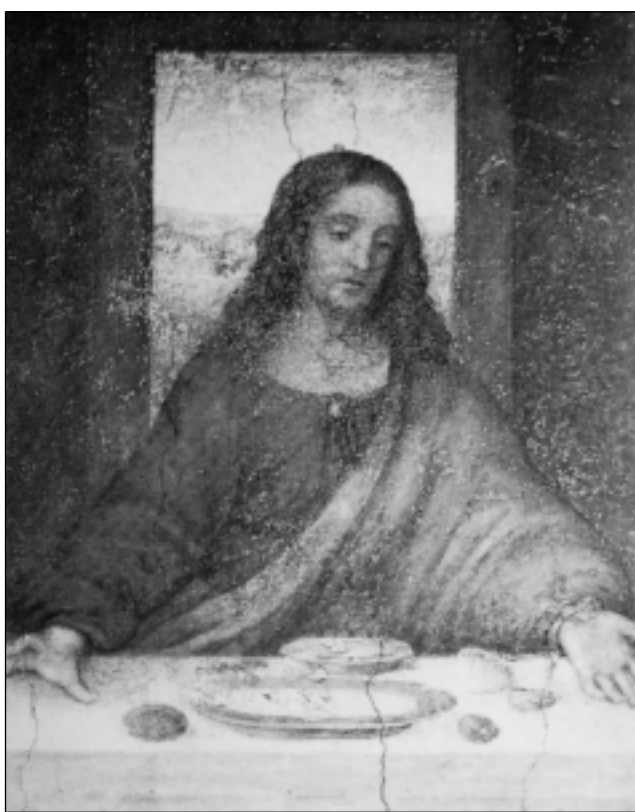
Cristo è risorto

La Quaresima è allora il tempo in cui lasciarci riconciliare con Dio per riscoprire la novità che Egli per noi realizza proprio nel mistero pasquale: c'è una via nuova che Dio traccia per noi (cfr. Is 43,16-21)... c'è una vita nuova, da risorti, che Egli ci propone