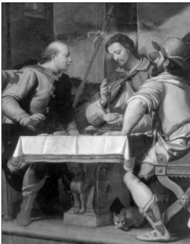
I discepoli di Emmaus riconobbero Gesù mentre spezzava il pane

Maria di Magdala invece avrà una apparizione di angeli che la aiuteranno a vedere oltre la morte della materia. Maria era rimasta legata e si accontentava di sentirsi vicino a quanto rimaneva di Gesù. Rivoleva almeno il corpo di Gesù, anche se morto...: "hanno portato via il mio Signore e non so dove lo hanno posto. Detto questo si voltò e vide Gesù che stava lì in piedi, ma non sapeva che era Ge-