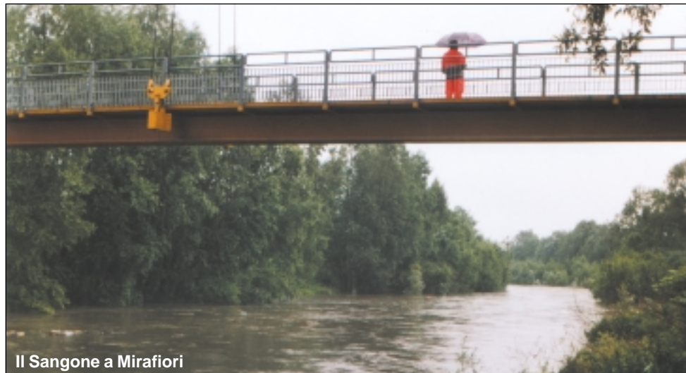
Il Sangone a Mirafiori