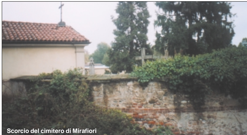
Scorcio del cimitero di Mirafiori

Per la festa di Ognissanti tutta la comunità parrocchiale è chiamata a raccogliersi in preghiera nel cimitero di Corso unione Sovietica. Anche quest'anno si rinnoverà la bella tradizione che ormai da tanti anni ci permette di ricordare i nostri cari defunti. Nella cappelletta del cimitero verrà celebrata l'Eucarestia e si potrà riflettere sul significato della vita terrena e sulla vita eterna. Verranno ricordati in particolare le persone che ci hanno lasciato in questo ultimo anno. L'appuntamento è per sabato 1 novembre alle 15.00.