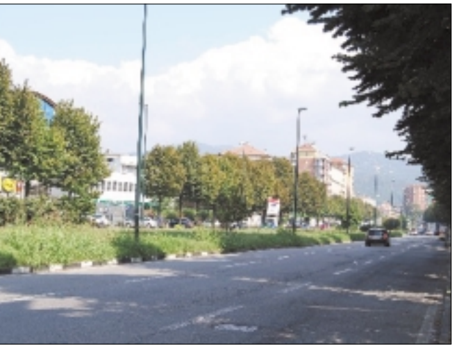
Lo spartitraffico centrale di via O. Vigliani dove dovrebbe essere spostato provvisoriamente il mercato

Assicurare il coinvolgimento delle Circoscrizioni 9 e 10, unitamente ai Settori Parcheggi e Mobilità, in prossimità dell'avvio dei la-