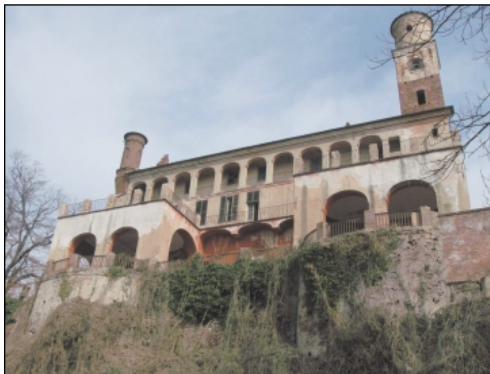
Vista facciata meridionale del Castello

Ed è il legame col passato rurale e contadino ad emergere ancora oggi quando si visita il complesso del castello, il quale appare affiancato da un esteso complesso di cascine ed edifici, alcuni dei quali antichi quanto il maniero stesso, e circondato da campi agricoli e boschetti fluviali lontano dalle mani della speculazione edilizia altrimenti imperante. Gran parte dei terreni e le cascine sono state infatti recentemente acquistate dal Comune e da una Cooperativa edilizia che insieme intendono recuperare il complesso rivalutando proprio l'aspetto rurale, inserendo un ecumeno