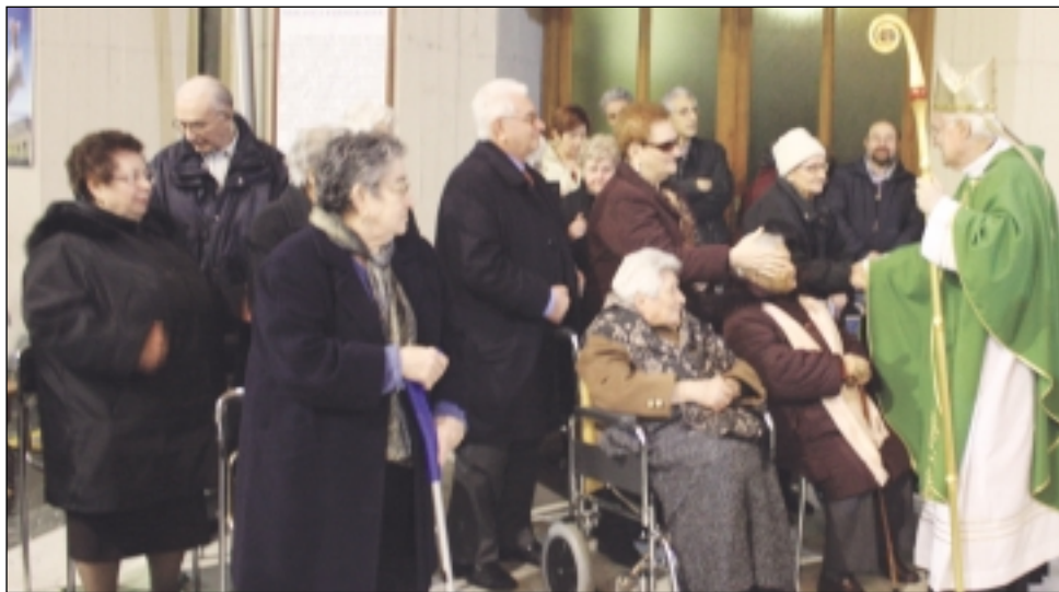
Al termine della S. Messa il vescovo ha salutato gli ammalati presenti

Nell'omelia il Vescovo prendendo spunto dalle parole della prima lettura (Sir 15,16-21): "Davanti agli uomini stanno la vita e la morte, il bene e il male: a ognuno sarà dato ciò che a lui piacerà", ha evidenziato come ciascuno di noi sia posto davanti ad una scelta fondamentale nella vita: fare del bene e donare amore oppure fare del