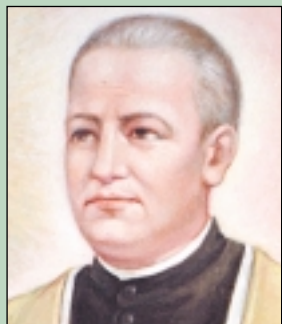
Beato Clemente Marchisio