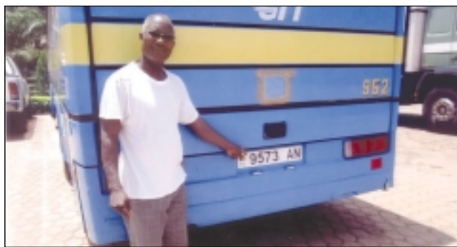
"Caro don Matteo e cari parrocchiani di San Luca, con gioia e a nome della nostra diocesi di Anèho, vi ringraziamo per il dono di questo autobus che sarà veramente un grande aiuto per noi. Eccolo con la targa del Togo". P. Severin