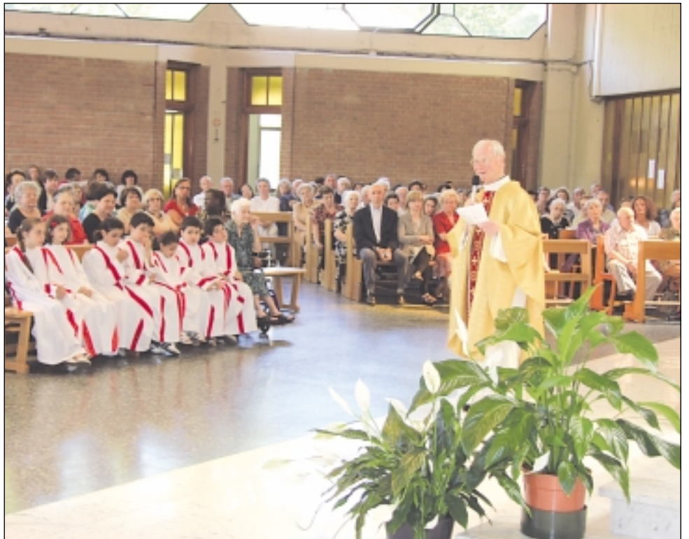
Don Matteo ricorda i suoi 50 anni di sacerdozio (30 giugno 2013)

– Grazie per l'attualizzazione e la concretezza presente sempre nelle tue omelie; anche se alle volte da qualcuno non condivi-