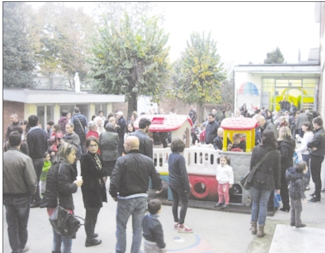
Famiglie e bimbi in festa nel cortile della scuola

no ritrovati in un bel pomeriggio di festa.