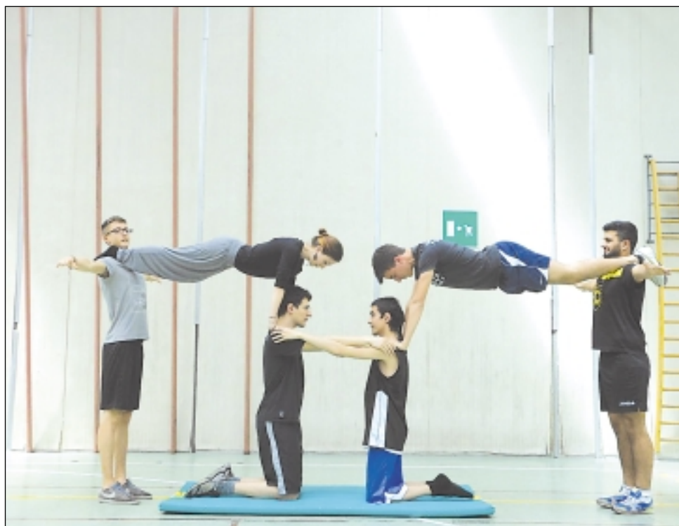
Allievi in prove di equilibrismo

Il Primo Levi nel sostenere la sua candidatura al LISS (Liceo Scientifico Sportivo), la cui approvazione definitiva avverrà con la pronuncia della Giunta Regionale alla fine del mese di dicembre, valorizza la forza dei suoi impianti: due palestre coper-