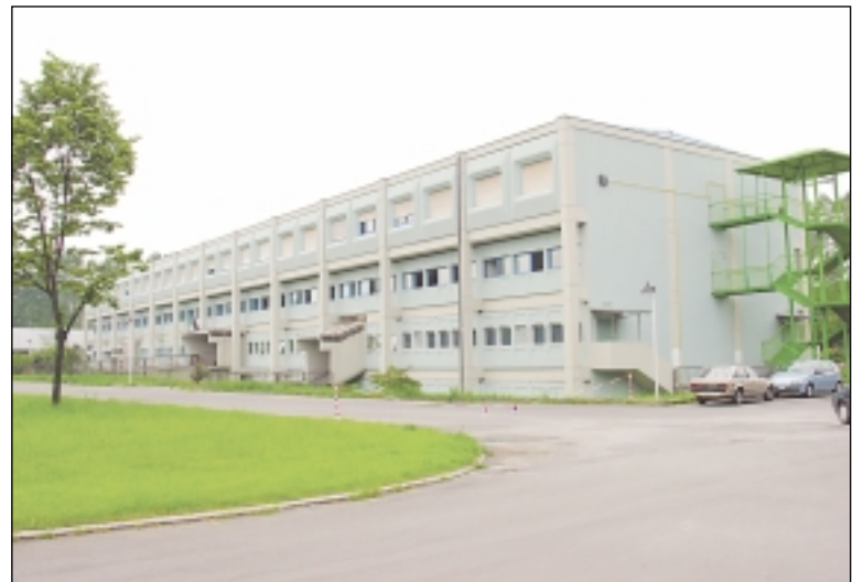
I.I.S. Primo Levi

su cui innestare i talenti di ognuno e far sì che si traducano in progetti di vita; siamo consapevoli infatti di accogliere ragazzi quattordicenni poco più che bambini e di "consegnarli", al termine del percorso formativo, divenuti ormai uomini e donne, in grado di assumere la responsabilità delle loro scelte; per questo non vogliamo sottrarci all'impegno educativo (non siamo solo un'agenzia di istruzione) e intendiamo accompagnare questi giovani nella definizione dei loro progetti perché la fortuna invocata da Seneca si traduca per loro in occasione di successo formativo e scelta consapevole e fiduciosa; • non ci interessano dun-