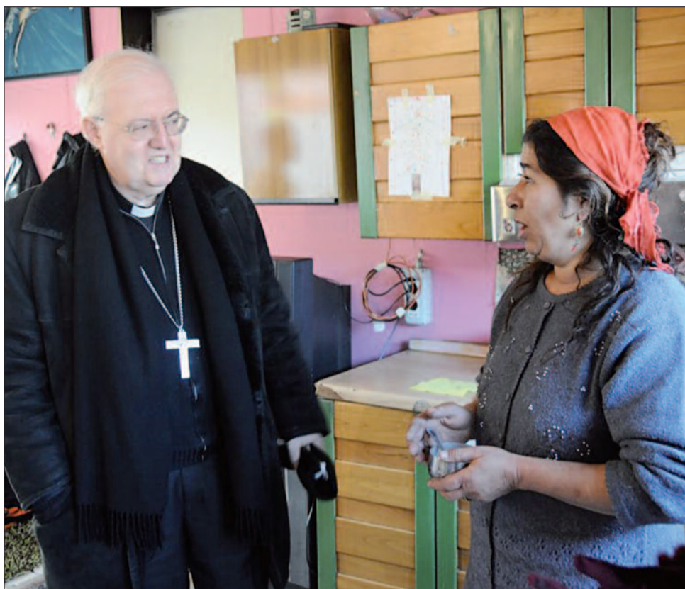
Mons. Nosiglia incontra i Rom a Torino

Una conversione che si allarga dal cuore di ognuno di