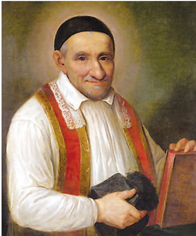
L'amore di Dio è in alto; al centro è la carità del prossimo e l'amore dei poveri; e in basso è la carità tra voi (San Vincenzo de' Paoli)

Per far fronte a tutto ciò, c'è quindi bisogno di più risorse