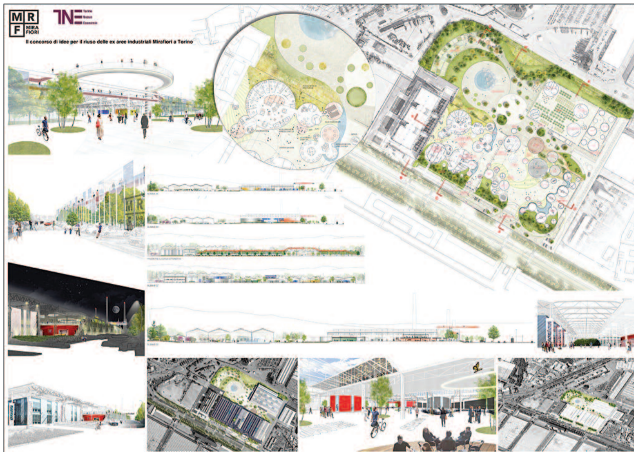
Ecco il progetto vincitore del "Concorso Mirafiori"

L'intento è stato quello di avviare un'esplorazione che potesse suggerire strade possibili per un intervento importante per la città, con un'attenzione particolare alle esigenze espresse dal terri-