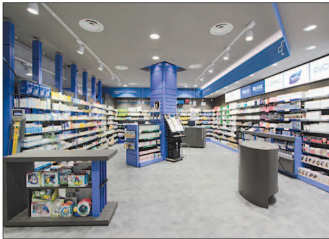
Nuovo allestimento con colori che valorizzano il legame col territorio

L'azzurro intenso, che ricorda il cielo ampio e terso del quartiere Mirafiori Sud, viene replicato in vari elementi di arredo per lasciare