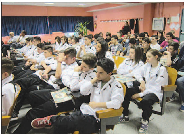
La classe 1ª LISS

Il nostro scopo è fornire molteplici stimoli, opportunità di conoscenza e, attraverso lo sport, suggerire ai nostri studenti stili di vita sani e fondati sui valori veri dell'impegno, del sacrificio, della fatica, riconosciuti e