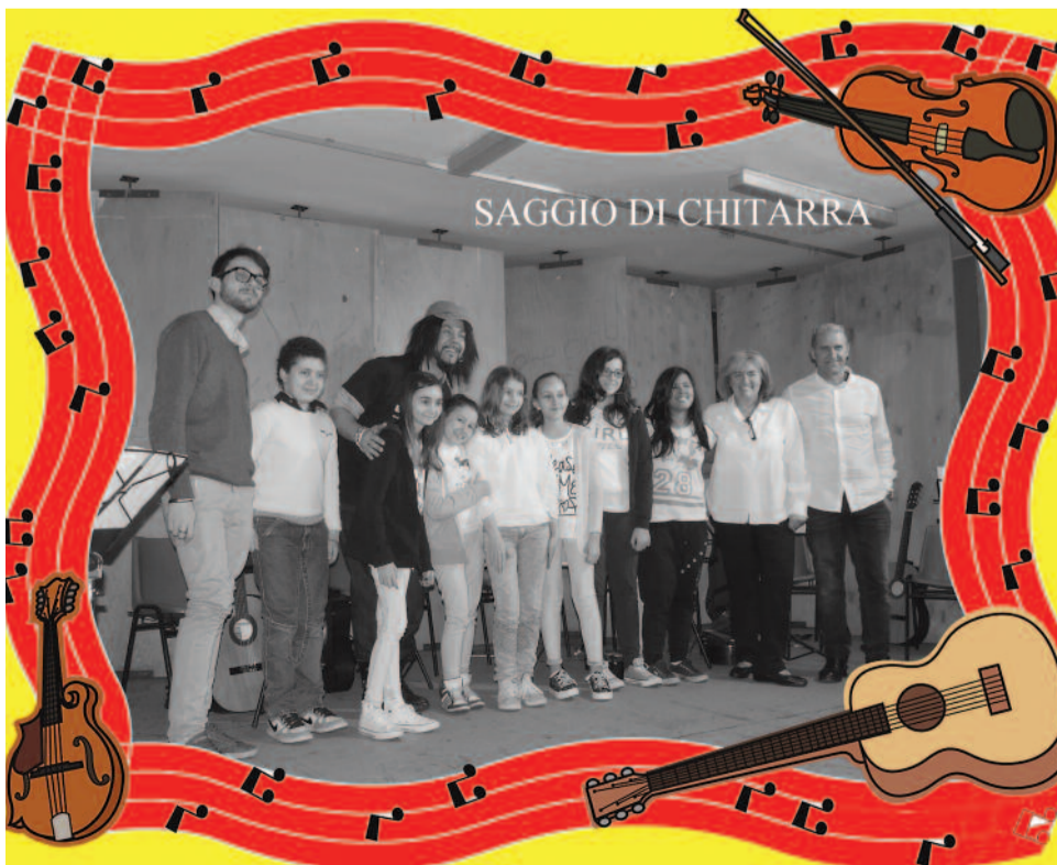
SAGGIO DI CHITARRA