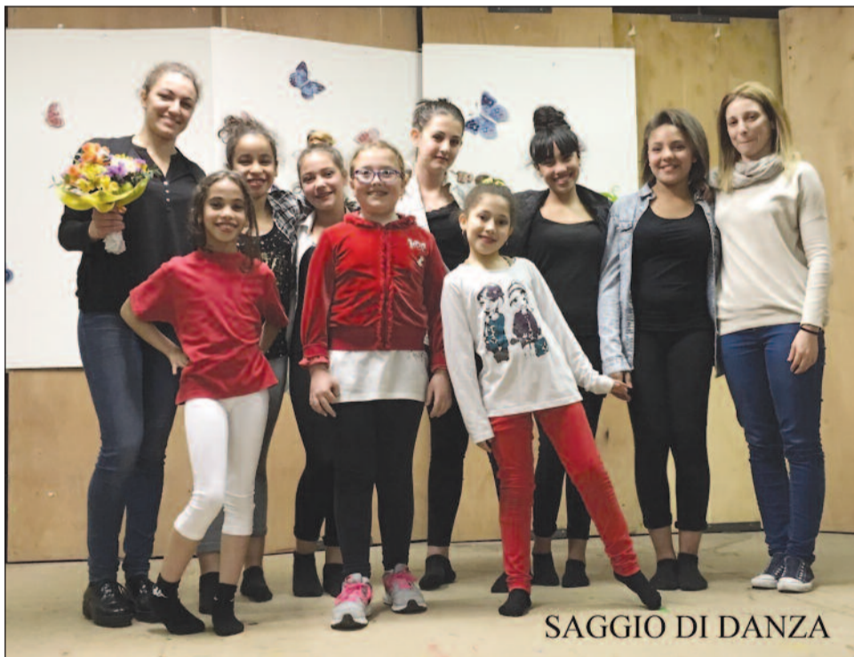
SAGGIO DI DANZA

SI CERCANO volontari per la pulizia della chiesa (rivolgersi in ufficio parrocchiale) GRAZIE