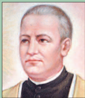
Beato Clemente Marchisio