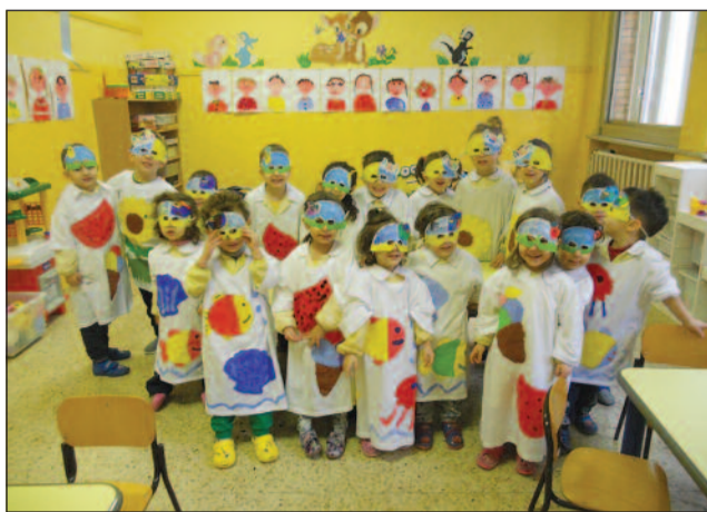
Una giornata di gioco per i piccoli allievi

inglese, musicoterapia, educazione motoria, laboratorio