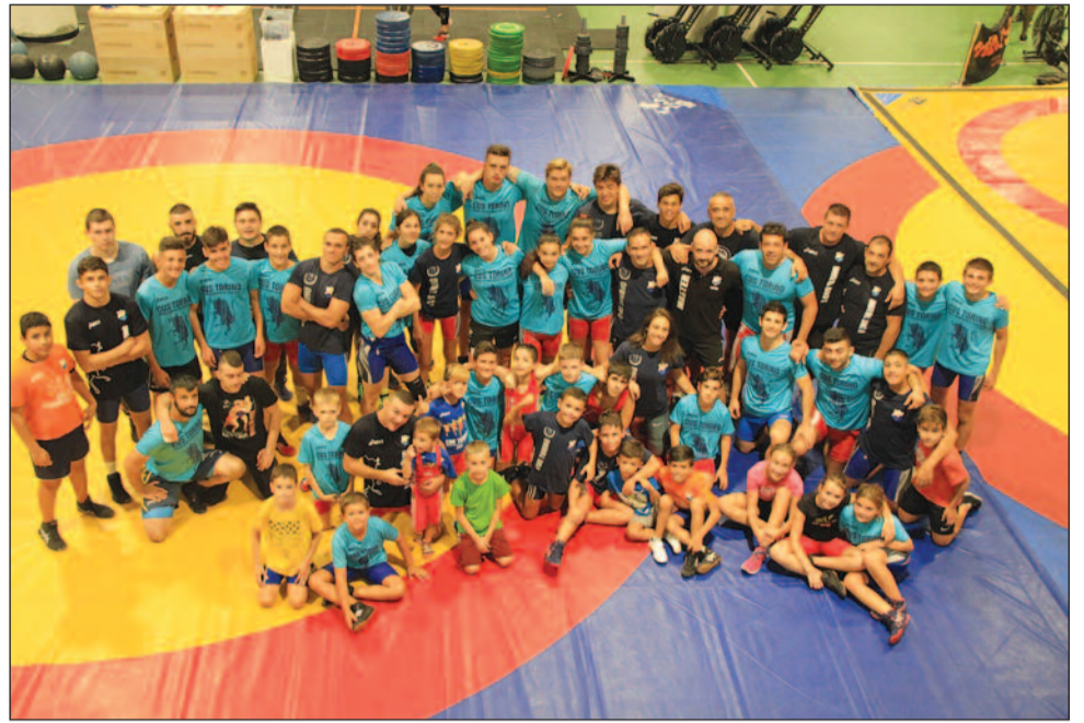
Atleti del CUS di ogni età si incontrano ogni sera con impegno

Nascono in Via Quarello, giovani campioni della lotta greco-romana e lotta libera