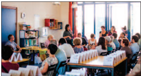
Uno degli incontri presso la Casa nel Parco

Inoltre, uno sportello sociale fornirà orientamento per chi vive difficoltà socio-economiche e abitative. Verrà anche organizzato