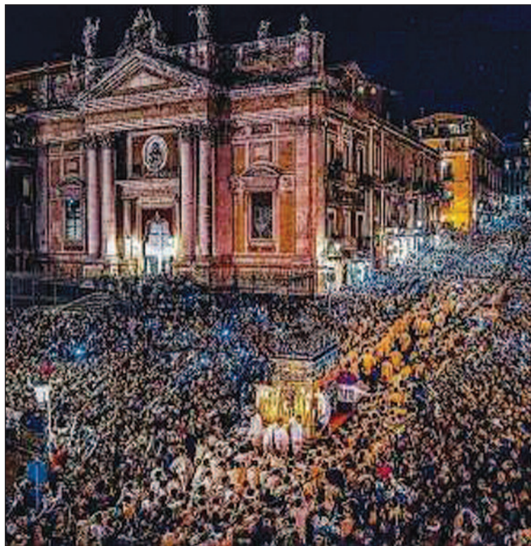
Migliaia di catanesi assistono alla processione per le vie della città siciliana

Nel giorno 2 Febbraio festa della Candelora l'Arcivescovo benedice le candele che il